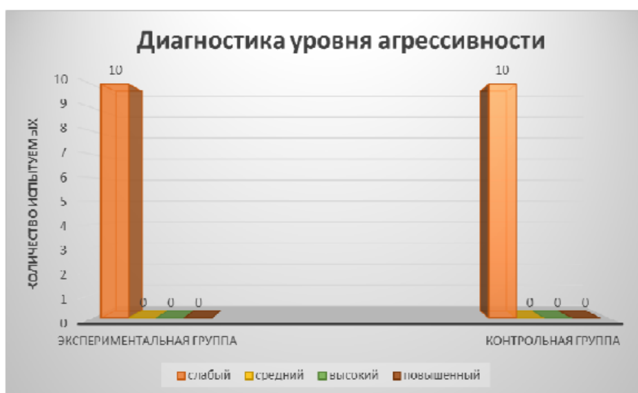
Рис. 3. Уровень агрессивности

Исходя из результатов теста Бойко В.В. Диагностика коммуникативных установок, представленных на диаграмме, можно сделать предварительные выводы и отметить, что экспериментальная группа имеет выраженный уровень негативной коммуникативной установки (6 из 10 человек), и контрольная группа также имеет преобладающий выраженный уровень негативной коммуникативной установки, но в другом количестве (8 из 10 человек).