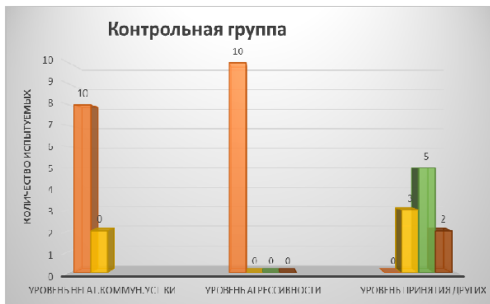
Рис. 5. Результат исследования контрольной группы

Анализируя результаты исследования, полученные по проведенным методикам, можно проследить, что у экспериментальной группы показатели по тесту Бойко В.В. Диагностика коммуникативных установок имеют выраженную негативную коммуникативную установку в количестве 6 из 10 человек, проективная методика «Рисунок несуществующего животного» имеет ярко выраженный слабый уровень агрессии (10 из 10 человек). Завышенный уровень негативной коммуникативной установки, как уже говорилось ранее, может не влиять на уровень агрессивности в целом, т.к. у подростка нет предшествующего жизненного коммуникативного опыта и сформировавшейся, целостной «Я-концепции» в силу своего возраста, поэтому комму-