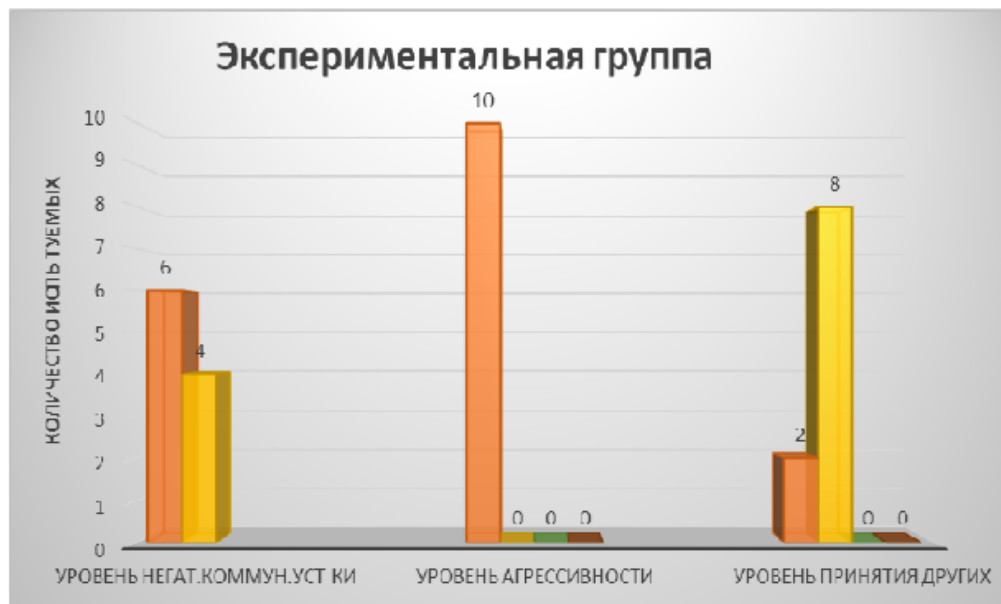
Рис. 4. Результат исследования экспериментальной группы

Исходя из результатов проективной методики «Рисунок несуществующего животного» (М.З. Дукаревича), представленных на диаграмме, можно сделать предварительные выводы и отметить, что экспериментальная группа имеет выраженный слабый уровень агрессии (10 из 10 человек), в то время, как и у контрольной группы имеется так же, как и экспериментальной группы, выраженный слабый уровень агрессии (10 из 10 человек).