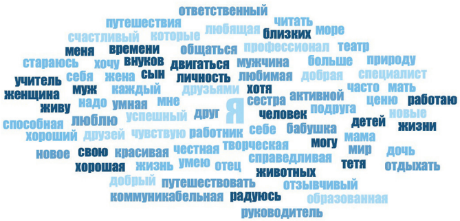
Рис. 3. Облако слов у взрослых респондентов (40–70 лет). Pic. 3. Word cloud from adult respondents.

идентифицировал себя с ними, то он уделяет им много места в представлении о себе. Самораскрытие способностей у старшего поколения приобретает контрастность. Это выражается в том, что если у субъекта зафиксировано самораскрытие способностей, то он склонен указывать как можно больше категорий собственных способностей. Самораскрытие воплощается в языке. Респонденты из старшей возрастной группы значительно чаще в составе текста